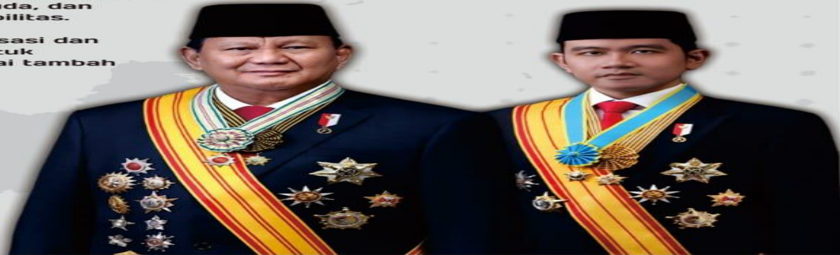
Prabowo Subianto Presiden Republik Indonesia

Memperkuat penyelarasan kehidupan yang harmonis dengan lingkungan, alam, dan budaya, serta peningkatan toleransi antarumat beragama untuk mencapai masyarakat yang adil dan makmur.