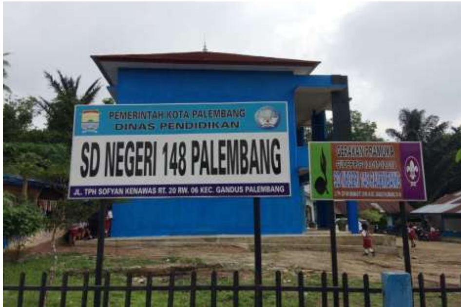
Gambar 1 Papan Nama SD Negeri 148 Palembang