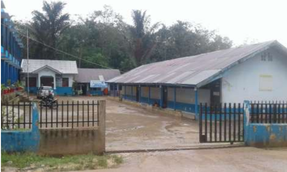
Gambar 3 Tampak Depan SD Negeri 148 Palembang