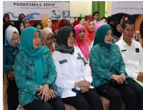
Gambar 9. Foto Acara lintas sektor di Puskesmas Sekip Sosialisasi dan edukasi pencegahan dan penanganan Stunting di Kecamatan Kemuning