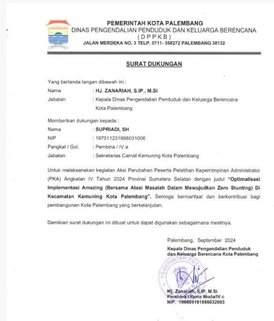
Gambar 16. Foto Dukungan dari DPPKB kota Palembang