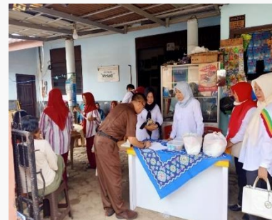
Gambar 7. Monotoring Perkembangan anak Stunting