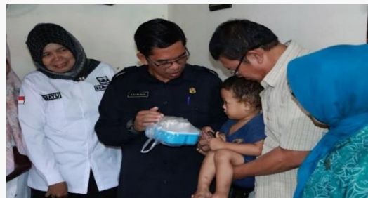
Gambar 5. Melakukan PMT ( Pemberian Makanan Tambahan ) kepada anak Stunting dan Monitoring Perkembangan anak Stunting