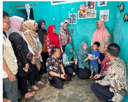
Gambar 11. Monotoring anak yang stunting