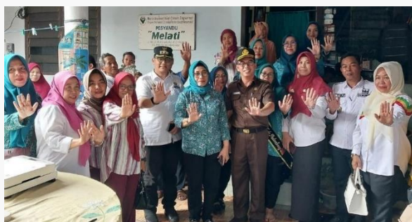
Gambar 8. Monitoring dan Pemberian makanan tambahan (PMT) kepada anak Stunting Bersama Pj. Ketua TP PKK Kota Palembang didampingi Camat Kemuning dan Stakeholder di Kecamatan Kemuning