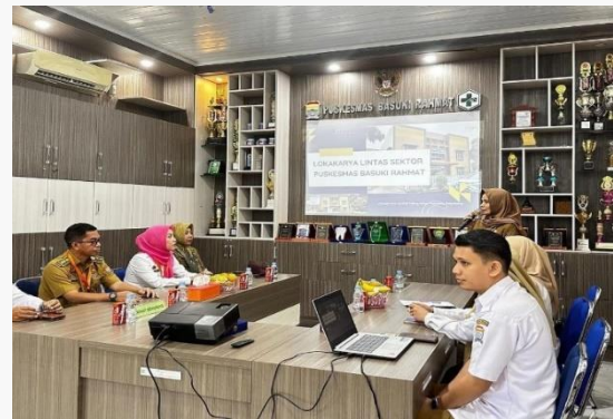
Gambar 2. Rapat Koordinasi dengan pihak terkait