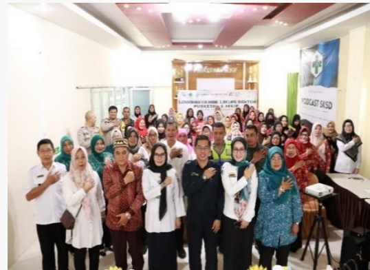
Gambar 4. Koordinasi dengan stakeholder Eksternal dikecamatan Kemuning