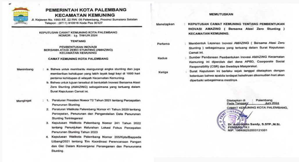
Gambar 12. Surat Keputusan Pembentukan inovasi Amazing