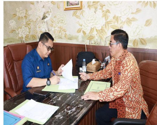
Gambar 1. Kegiatan Menghadap mentor untuk Konsultasi dan Bimbingan