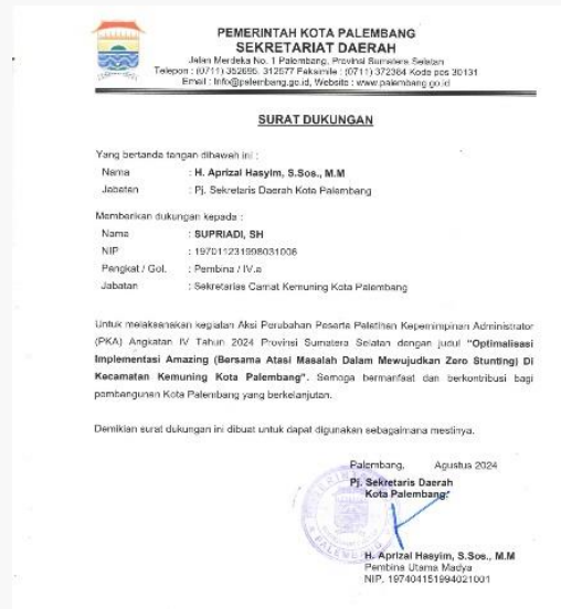
Gambar 14. Foto Dukungan dari Sekertaris Daerah kota palembang