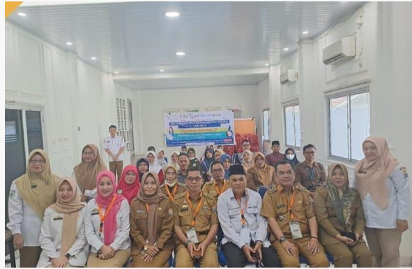
Gambar 3. Foto Acara lintas sektor di Puskesmas Basuki Rahmat Sosialisasi dan edukasi pencegahan dan penanganan Stunting di Kecamatan Kemuning