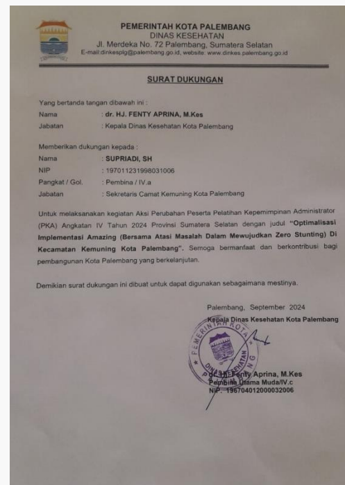
Gambar 17. Foto Dukungan dari Dinas Kesehatan kota Palembang