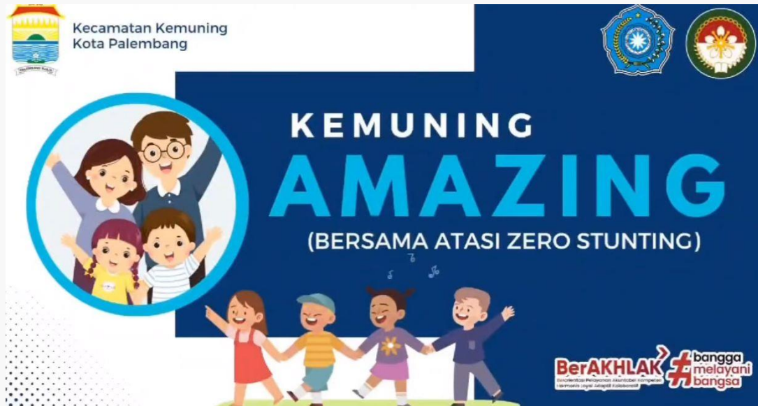
Gambar 20. Spanduk Amanzing (Bersama Atasi Masalah dalam mewujudkan Zero Stunting)