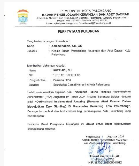
Gambar 15. Foto Dukungan dari BPKAD kota Palembang