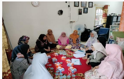
Gambar 6. Sosialisasi Tentang pola hidup sehat, bersih dan Dampak Sanitasi Yang Buruk